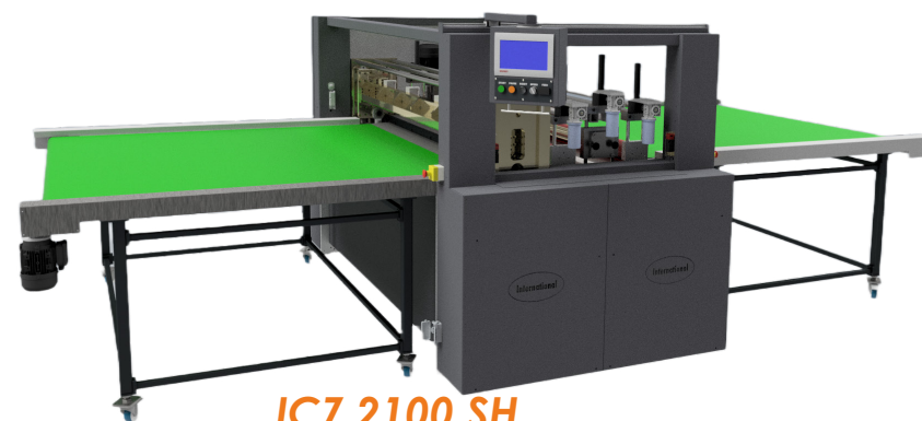
ICZ 2100 SH