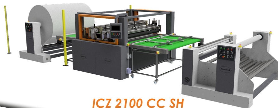
ICZ 2100 CC SH

THE WIDTH OF THE WORKSPACE FOR THE MATERIAL VARIES ACCORDING TO THE TYPE OF THE MACHINE: 1300, 1600 AND 2100 MM. DIE BREITE DES ARBEITSRAUMS FÜR DAS MATERIAL VARIERT JE NACH MASCHINENTYP: 1300, 1600 UND 2100 MM.